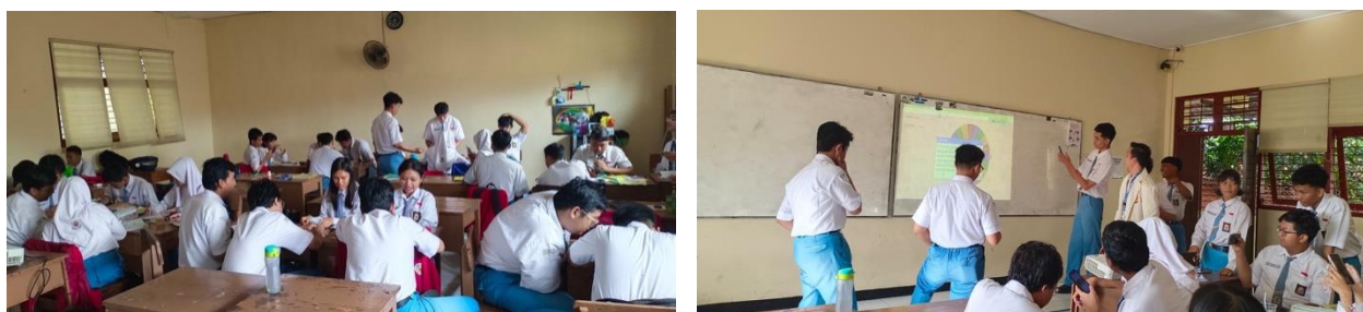
Gambar 1. Proses Pembelajaran Menulis Cerpen menggunakan Metode Estafet Writing melalui Media Spinner.

Penerapan metode ini menggunakan model pembelajaran PJBL ( Project Based Learning ). Berikut langkah-langkah pembelajaran menulis cerpen menggunakan metode estafet writing dengan media spinner.