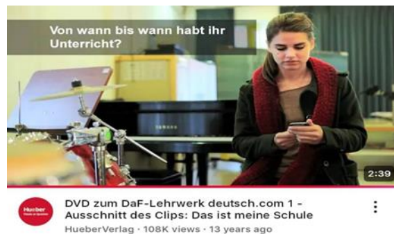
Gambar 2. Video Pendek yang Disajikan Peneliti

Pada kegiatan inti, peneliti menampilkan video pendek bertema lingkungan sekolah. Beberapa siswa menunjukkan keterlibatan aktif dengan berdiskusi tentang isi video dan menyebutkan kosakata yang relevan. Contohnya 1 orang siswa aktif yang dapat menyebutkan 6 kosakata yang ada di video, dan ada 4 orang siswa yang duduk di belakang yang kurang menyimak penyajian peneliti. Namun, beberapa siswa masih memerlukan bimbingan tambahan agar memahami kosakata yang digunakan dalam video. Setelah menampilkan video pendek, peneliti kemudian menyajikan teks terkait In der Schule yang dilengkapi dengan latihan soal berbentuk richtig/falsch . Saat menyajikan teks, peneliti berusaha menggali pemahaman siswa terhadap kosakata, dan sebagian siswa mampu menerjemahkan dan menyebutkan arti kata beserta artikelnya, contohnya seperti kata Schule . Akan tetapi, kebanyakan siswa masih sulit untuk mengingat kosakata seperti Schulhof , Bibliothek , dan Mensa sehingga masih memerlukan bantuan. Beberapa siswa menunjukkan inisiatif untuk menjawab pertanyaan, meskipun masih ada yang ragu dan terganggu oleh lingkungan sekitar.