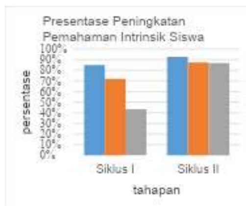
Gambar 2. Presentase Peningkatan Pemahaman Intrinsik Siswa Kesimpulan

Penerapan media ADEF dapat meningkatkan pemahaman unsur intrinsik cerita siswa kelas V SDN 04 Manisrejo Tahun Ajaran 2025/2026. Peningkatan pemahaman unsur intrinsik siswa kelas V SDN 04 Manisrejo setelah penerapan media ADEF ditunjukkan oleh meningkatnya